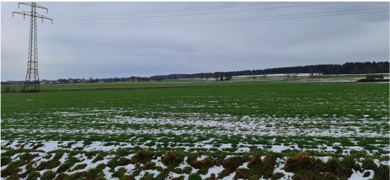
Abbildung 4: Flurstück 767 und 758

Das Flurstück befindet sich direkt angrenzenden an 758 und ist ähnlich gut geeignet. Die Fläche befindet sich in mehr als 250 m Abstand zu sämtlichen Gebäuden und Gehölzen. Im Süden befindet sich ein wenig befahrener Weg. Die geplante Agri-PV-Anlage befindet sich in unter 500m Entfernung. Im Süden befindet sich außerdem eine Hochspannungsleitung über der Fläche.