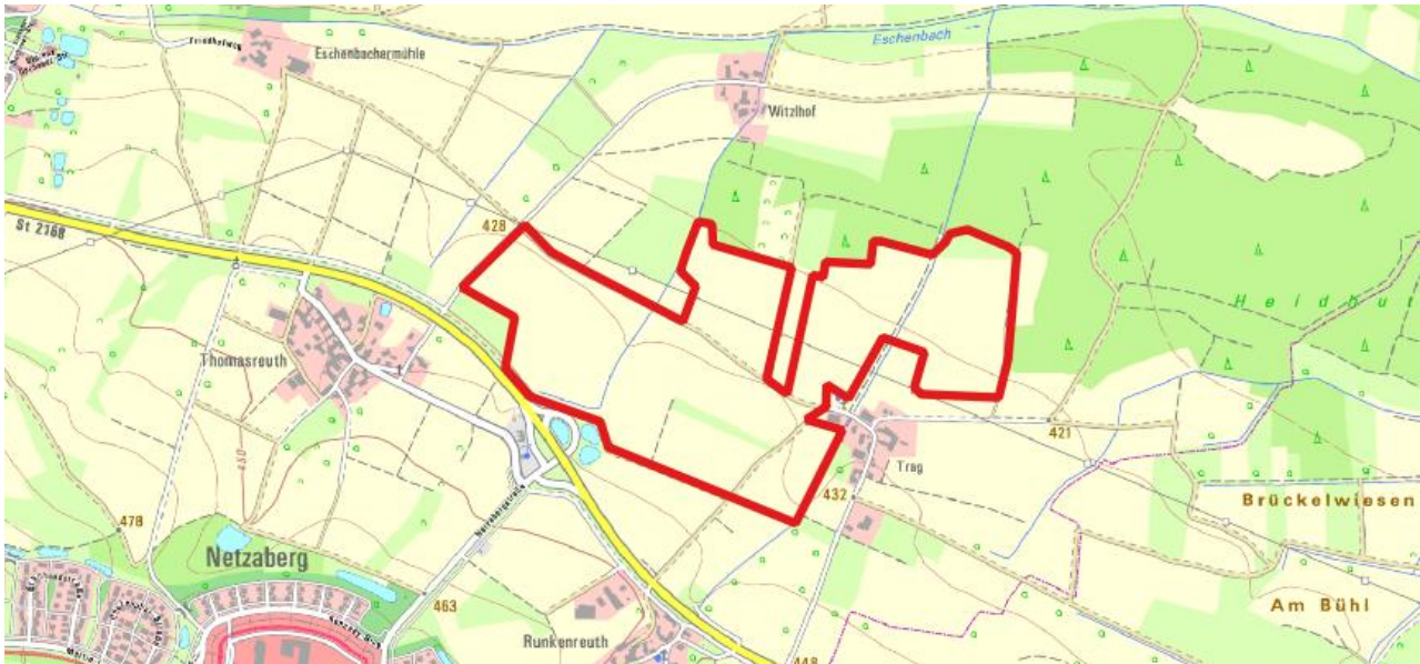
Abbildung 1: Lage des geplanten Solarparks (rot umrandet); (Quelle: © LDBV)

Auftraggeber: Buß Solar GmbH Nordring 82 46325 Borken