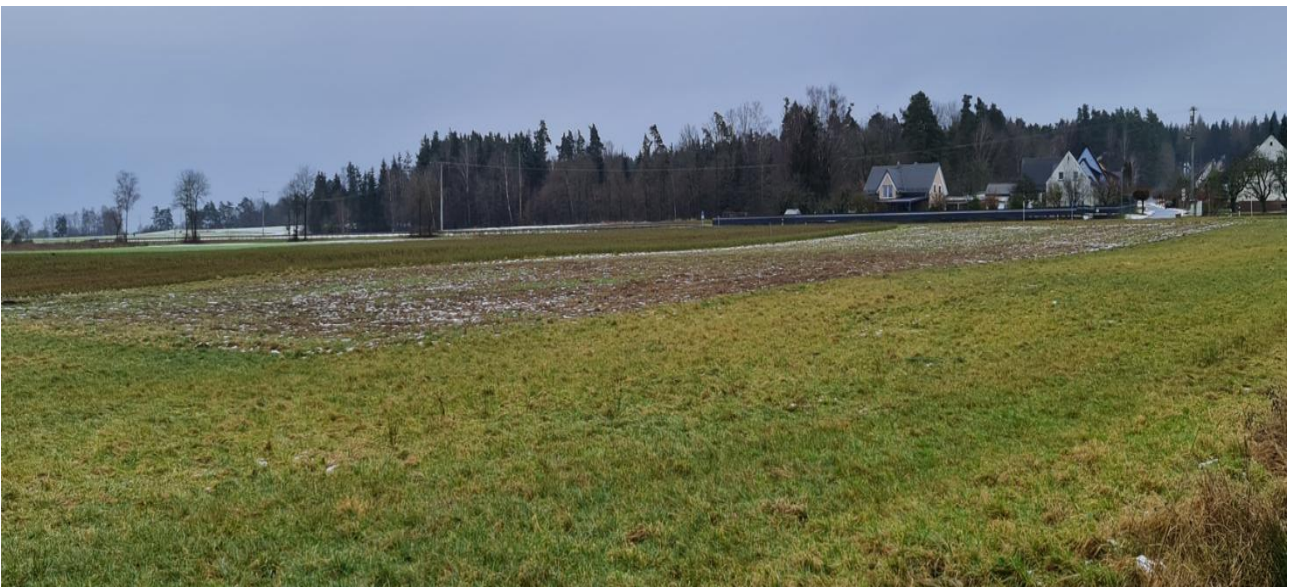
Abbildung 6: Flurstück 1343 mit Blick auf die Siedlung und die Staatsstraße im Süden

Das Flurstück 1343 befindet sich in mehr als 200m Entfernung zur geplanten Agri-PV-Anlage. Im Süden verläuft die Staatsstraße 2168, welche häufig frequentiert wird. Südlich der Straße befindet sich eine Siedlung. Nach Norden, Westen und Osten gestaltet sich die Agrarlandschaft offen.