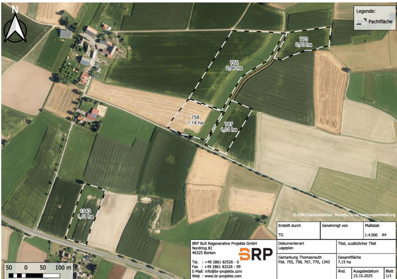
Abbildung 3: Lage der CEF-Flächen (schwarz-weiß umrandet)(Karte zur Verfügung gestellt durch den Auftraggeber)

Die Kartierung aus dem Jahr 2023 hat keine Meidungswirkung der Feldlerche in Bezug auf die Freileitung gezeigt. Aus diesem Grund wird die Freileitung nicht als Ausschlusskriterium für CEF-Flächen gewertet.