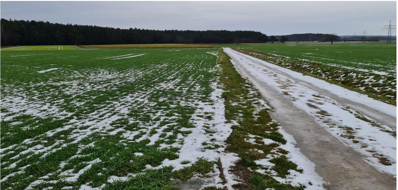
Abbildung 5: Flurstück 770